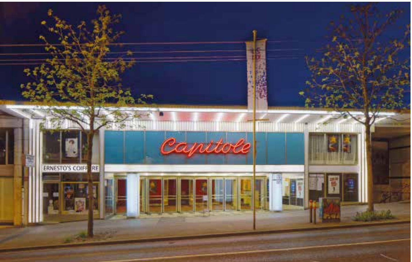
Interieur im Kino Corso in Lugano (oben). Hier gibt es nur noch sporadisch Vorstellungen. Das Capitole in Lausanne beherbergt 867 Plätze.